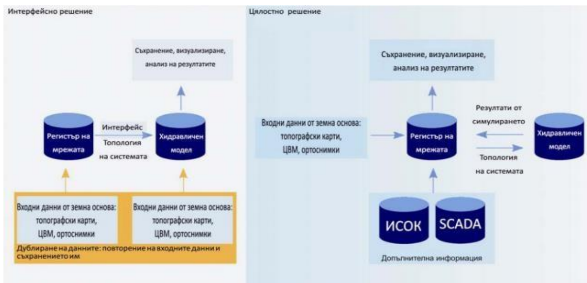
Фигура 1. Свързване на хидравличния модел с регистъра на мрежата

на базата на обслужвана зона, материал на тръбите, причина за аварията, големина на теча, вид на теча и дали е извършван ремонт. Такава информация помага за по-ефективното планиране на проектите за отстраняването на течове и подмяната на тръби. Графичното представяне на резултатите помага да се разкрият „горещи точки“ с течове, да се подредят по важност планираните ремонти, да се идентифицират проблемните материали и да се изпращат целенасочено екипи за отстраняване на аварията [2]. Хидравличните изчисления за водоснабдителните и противопожарните системи са неотменна част при анализа на възможностите на мрежата. Свързването на хидравличния модел с регистъра на мрежата, базиран на ГИС-технология, улеснява и ускорява многократно процеса на изграждане на модела – фиг. 1.